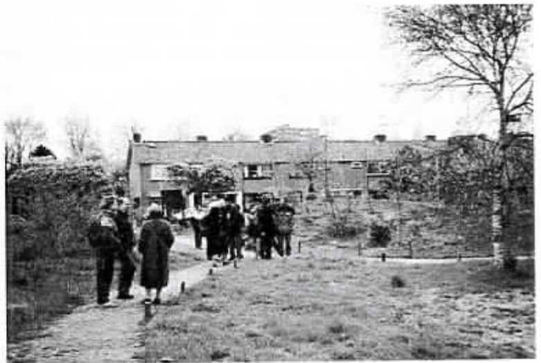
De wijknatuurtuin in Schalkwijk, Haarlem

Ongeveer om 12 uur 's middags vertrokken we 'carpoolend' naar de Heimanshof in Hoofddorp.