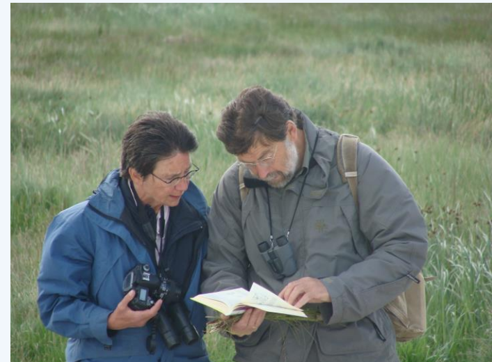
Excursie Voorne, Vakgroep Heemtuinbeheer, Juni 2008