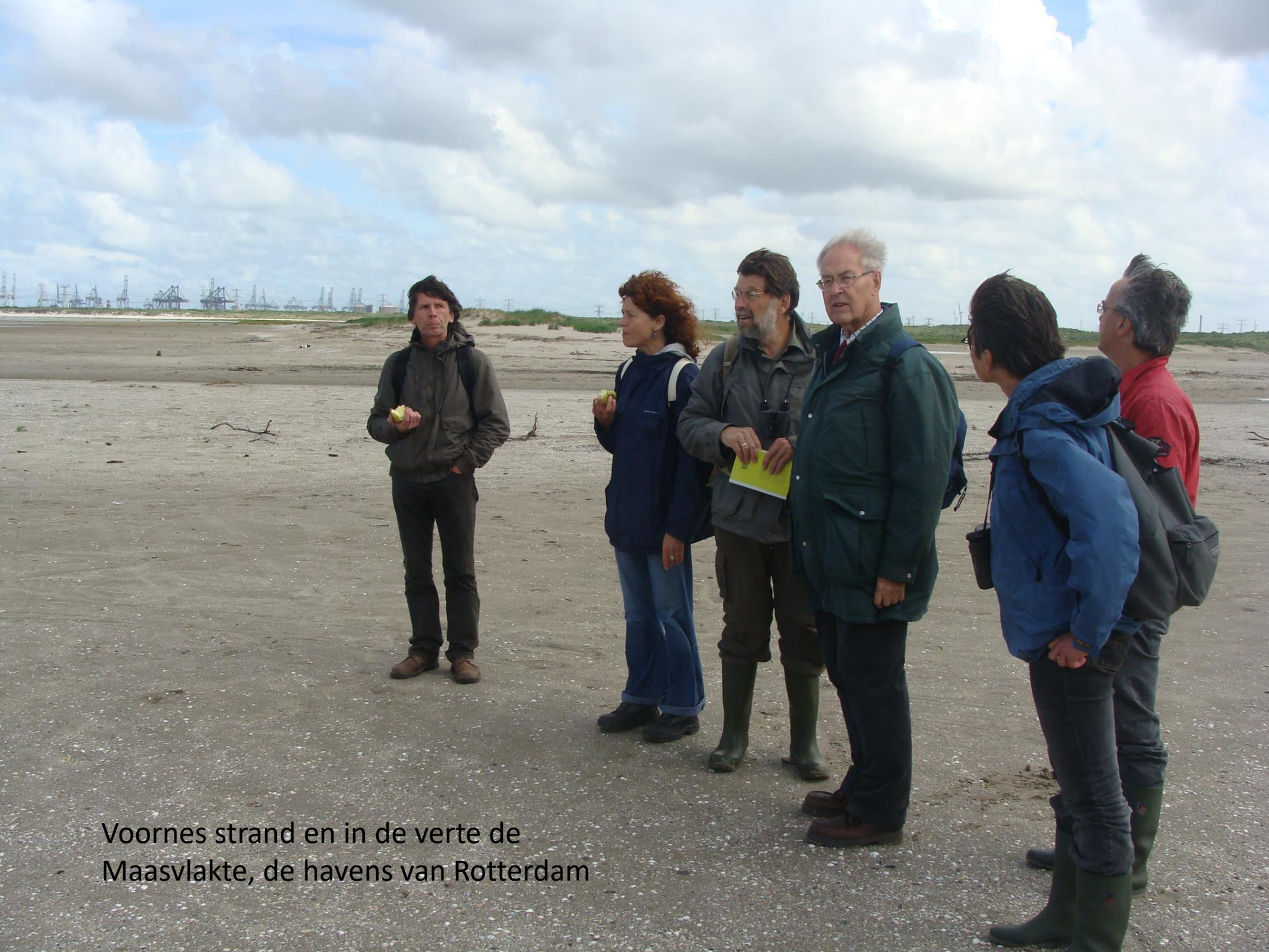
Voornes strand en in de verte de Maasvlakte, de havens van Rotterdam