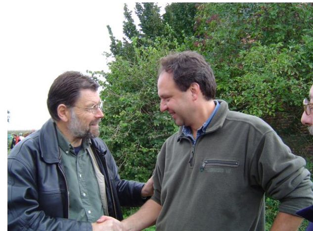
Bestuur Stichting Oase in Paulatem, september 2004