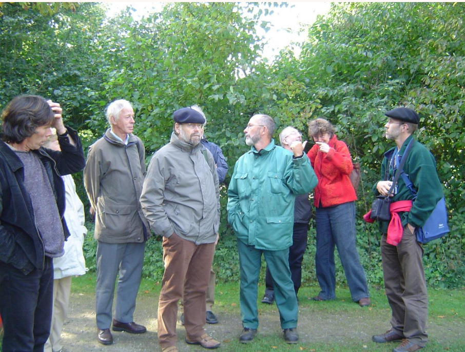
Heemtuin Presikhaaf Arnhem, oktober 2005