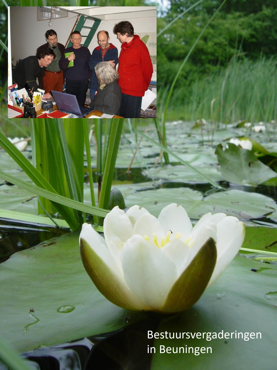
Bestuursvergaderingen in Beuningen