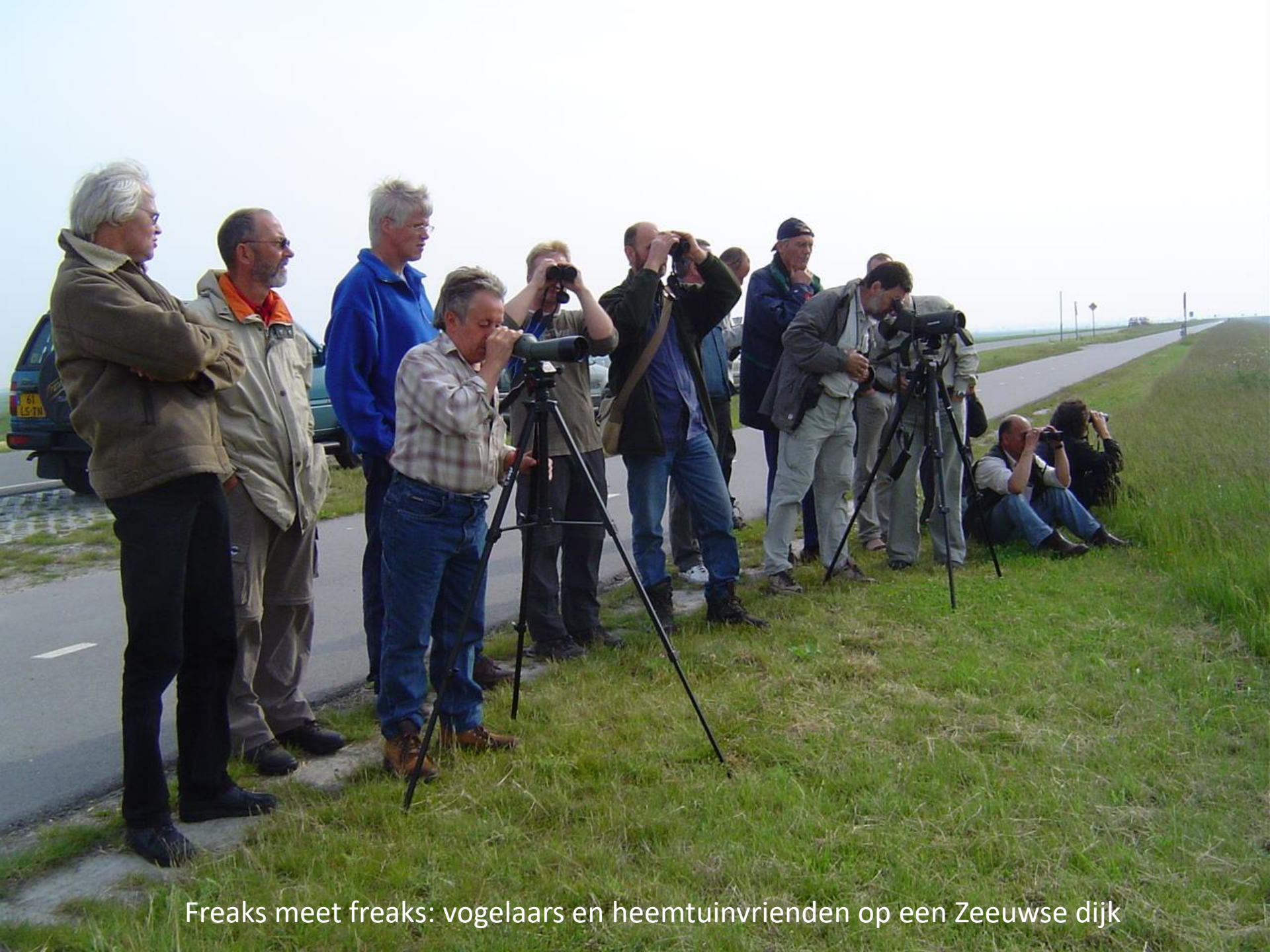
Freaks meet freaks: vogelaars en heemtuinvrienden op een Zeeuwse dijk