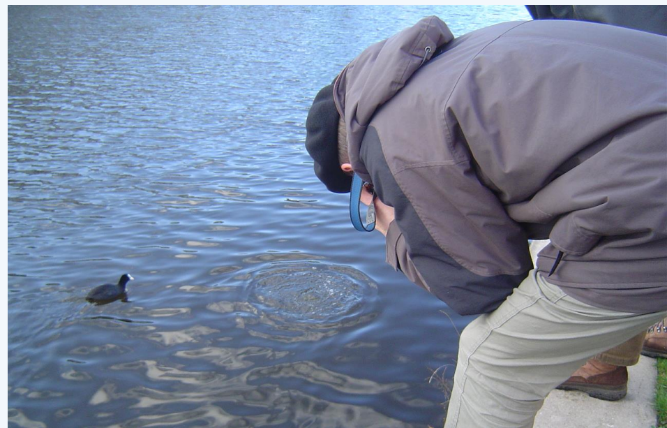
Bestuur Stichting Oase in Amsterdam, december 2006