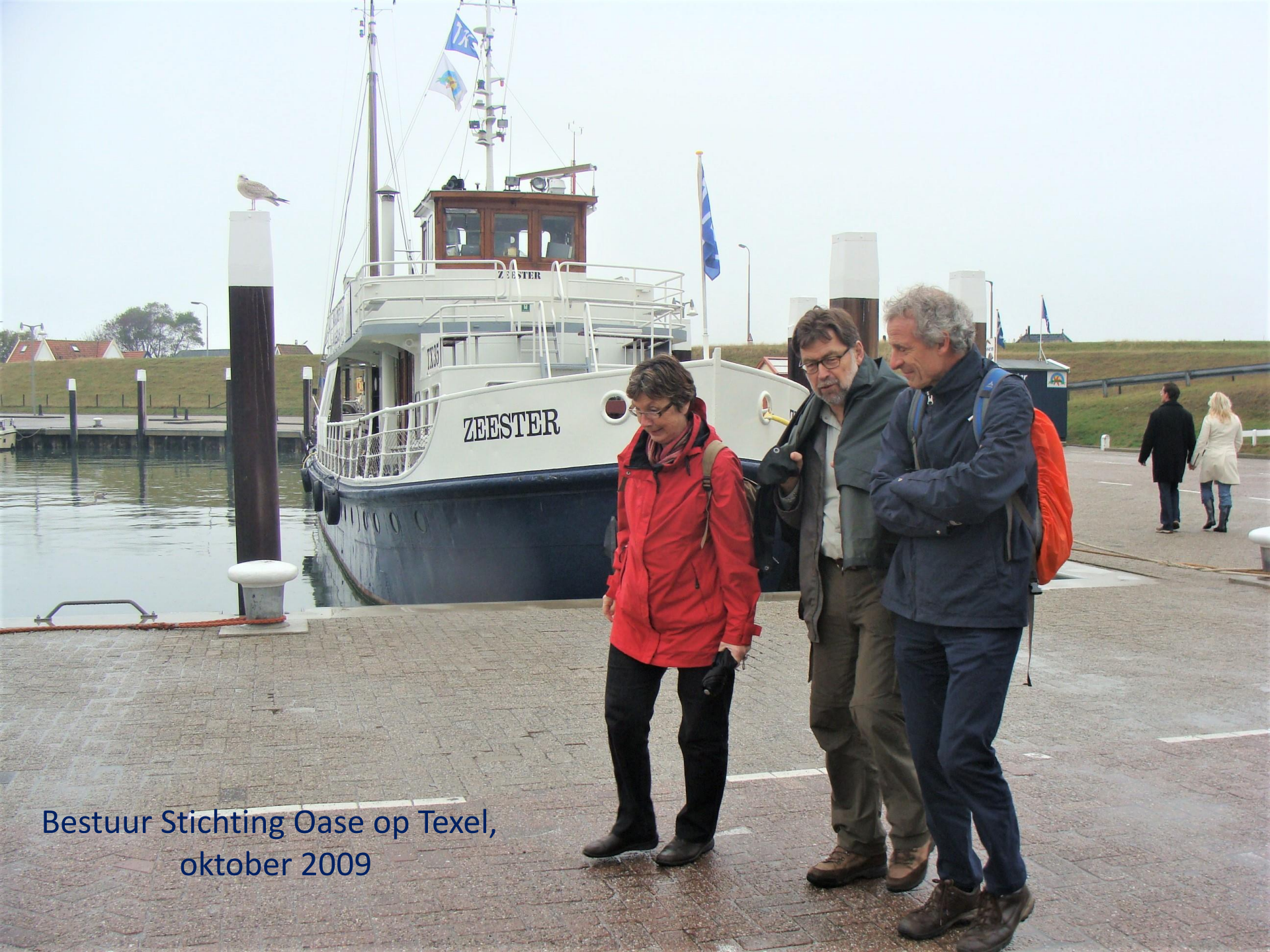
Bestuur Stichting Oase op Texel, oktober 2009