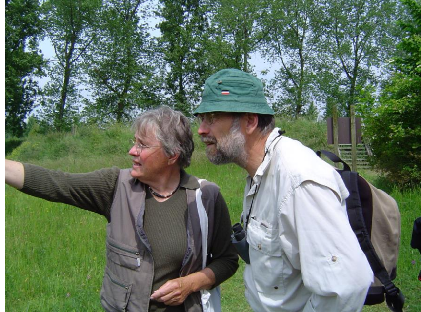
Vakgroep Heemtuinberheer in Zeeland, 3 juni 2005