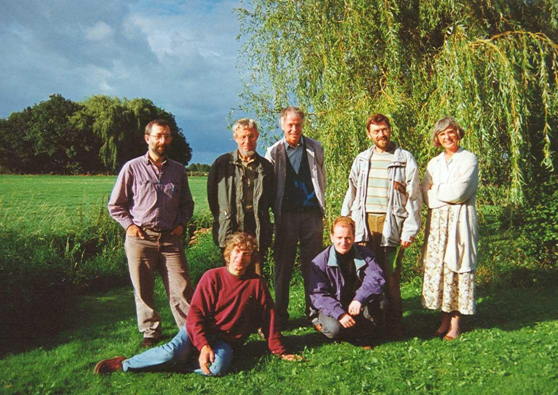
Eerste bestuur Stichting Oase bij de oprichting, 3-9-93