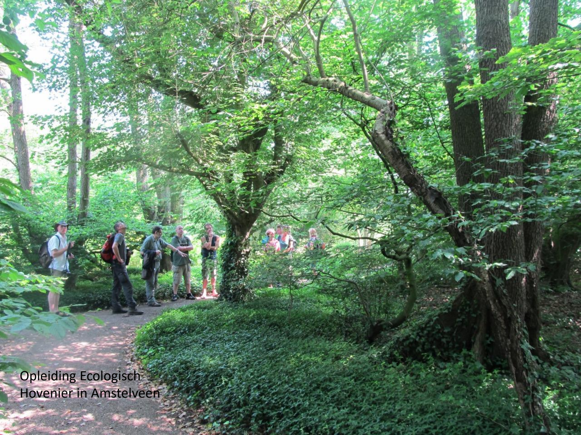
Opleiding Ecologisch Hovenier in Amstelveen