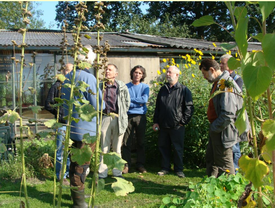
Bestuur Stichting Oase in Amersfoort e.o., september 2008