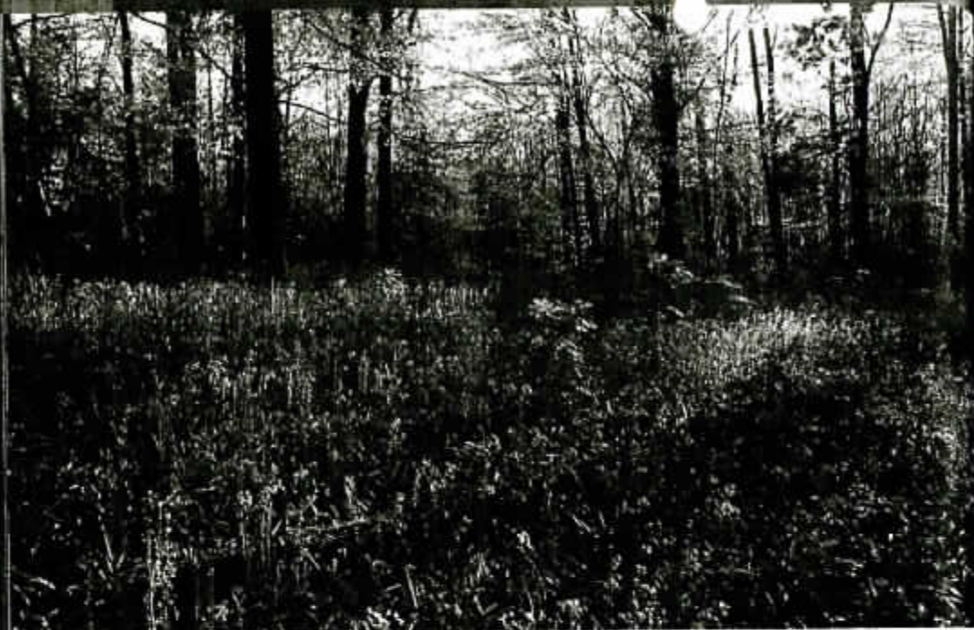
Bloeiende boshyacint

Het bos is voornamelijk een middelhoutbos (met zowel hakhout als hoogstammige bomen) met een goed ontwikkelde hakhoutlaag van voornamelijk zwarte els en gewone es. De boomlaag bestaat vooral uit zomereik, gewone es aangevuld met beuk, gladde iep en Canadapopulier. Het bos werd bovendien verrijkt met hazelaar, zoete kers, wilde mispel, wilde appel, tweestijlige meidoorn; kardinaalsmuts en wegedoorn.