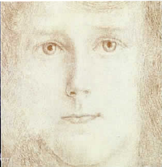
JAN TOOROP. 'Hoofd van een meisje', 1895. Lithografie, 14,1 x 13,8 cm. Sfinxachtige vrouwenblikken.

Een frisse wind waait door het vertrouwde. Belgische en Nederlandse kunstwerken, gemaakt tussen 1890 en 1945, hangen twee aan twee aan de wanden van het Gentse Museum voor Schone Kunsten. Zo maakt freelance curator Marc Lambrechts (52) op een radicale manier duidelijk dat aan het bevatten van het thema Verwantschap & Eigenheid een oefening voorafgaat in onderscheidend kijken naar wat het specifieke van een enkel kunstwerk uitmaakt. En hoe kan dat beter dan door het dicht in de buurt te brengen van een werk dat er zo goed op lijkt dat het erdoor geïnspireerd zou kunnen zijn?