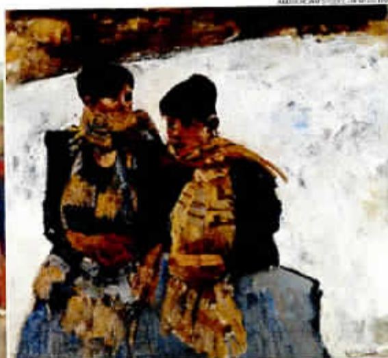
GEORGE HENDRIK BREITNER. 'Meiden in de sneeuw', ca. 1894. Olie op doek, 100 x 110 cm. Kernachtig openingsplatform.

► tiek opzet, ze zijn zozeer afgestemd op een eigen, naar absoluteitheid neigend intern evenwicht, dat een toenadering tot elkaar daaraan afbreuk doet.