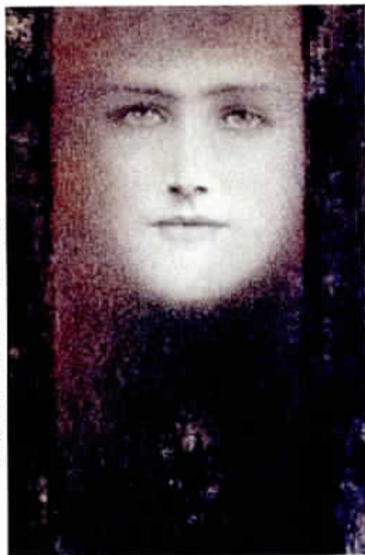
FERNAND KHNOPFF. 'Gelaat met zwart gordijn', ca. 1909. Pastel op papier, 25,5 x 16,5 cm. De bekoring van het etherische.

Het Gentse Museum voor Schone Kunsten paart Belgische aan Nederlandse kunstwerken uit de periode 1890-1945. Zo mag hun 'Verwantschap & Eigenheid' blijken.