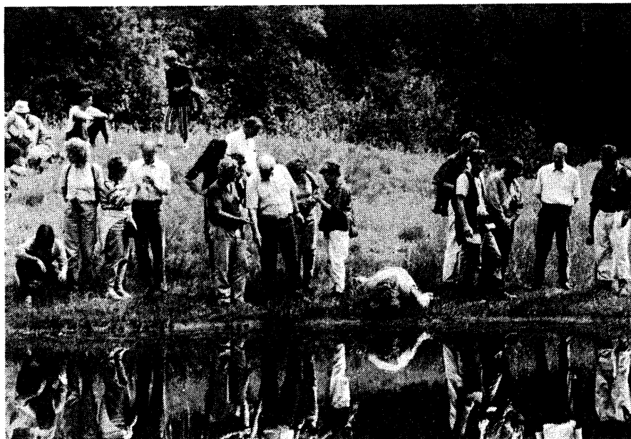
Veel interesse voor de spontane ontwikkeling in de natuurtuin in Hasselt.

Tenslotte willen we graag al die enthousiaste mensen (bijna allemaal vrijwilligers!), die ons rondleidden door hun paradijsjes en verwenden met allerlei lekkers voor lichaam en geest nog eens heel, heel hartelijk bedanken!! □