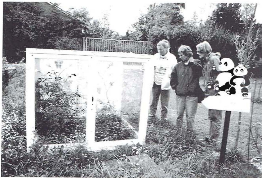
Vlinderobservatiekooi op het terrein van basisschool "De Panda" in Gent

onzinnigheid van een nabije waterzuiveringsinstallatie aan de kaak.