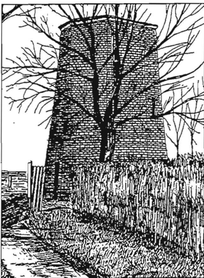
De watermolen (tekening: G. Boerjan)

Al gauw bleek het wat minder te regenen en liepen we - met uitgeleende regenjassen, laarzen en verrekijkers - achter Erwin aan, over zompige paden, langs drassige weilanden en sloten, even de meersen (beemden) in en dan weer op een dijkje met knotbomen tot we bij de restanten van een oude watermolen belandden. Hier bij de Leie stelde Erwin nog even overtuigend de