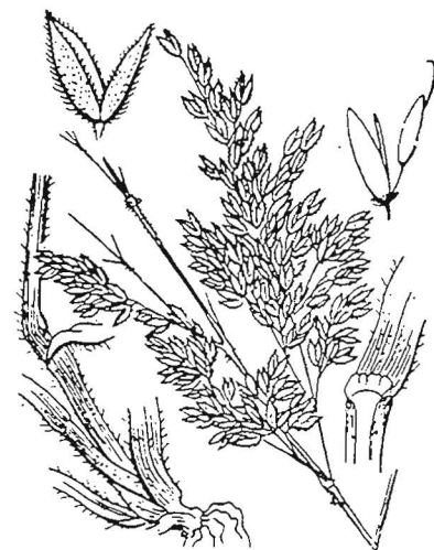
Gestreepte Witbol - Holcus lanatus

Alleen de woekerende Witbol vindt geen genade in de ogen van de fraters; bij een rondgang zie je frater Willibrordus dan ook regelmatig de ondiep wortelende Witbolpollen uit-trekken. "Frater Witbol noemen ze me hier al..."