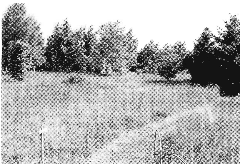
Tuinsferen: bloemrijk grasland, graspad met wilgetenen afscheiding en de bosrand

Frater Willibrordus is een boeiende rondleider, die niet alleen z'n planten en dieren kent, maar ook veel over de geschiedenis van de tuin,