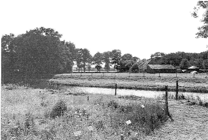
De Groenlose Slinge en het omringende landschap

Al gauw wandelden we op een van die prachtige voorzomerse dagen