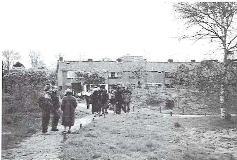
De wijknatuurtuin in Schalkwijk, Haarlem

Ongeveer om 12 uur 's middags vertrokken we 'carpoolend' naar de Heimanshof in Hoofddorp.