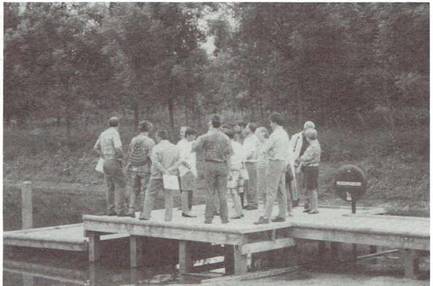
Rondleiding in natuurtuin Hof ter Saksen, 26 mei 1993

Na dit sprekersgedeelte verplaatste het gezelschap van Belgische en Nederlandse natuurtuinvrienden (ca. 50) zich per bus naar de tuin en na de officiële opening door de burgemeester van Beveren - hij knipte daarvoor met een heggescbaar een band van klimplanten, gespannen tussen twee takkenbussels door - werden de bezoekers in vier groepen uitgebreid door de tuin rondgeleid. Veel intensieve gesprekken vonden plaats, complimenten werden gemaakt en suggesties voor de toekomst aangereikt. Wie verbaast het dat