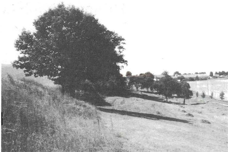
Een hoogstamboomgaard als toekomstig natuurtuinterrein

waar het in de berm wemelde van vijfdelig kaasjeskruid, zeer waarschijnlijk een relict uit de tijd dat dit dorp nog bestond (je komt de plant wel vaker in Europa op zulke plekken massaal tegen). De tuin, die hier gepland was, een 'duizendjarige tuin', zal waarschijnlijk niet uitgevoerd worden. De naam roept ongewenste associaties op en het conceptplan hinkte op te veel gedachten. We hebben graag met de initiatiefnemers meegedacht over een passender invulling van de tuin, die op een prachtige plek direct aan een groot meer gelegen is. Alle bezoekers van het openluchtmuseum wandelen langs deze tuin en het is er zo rustig, ruim en