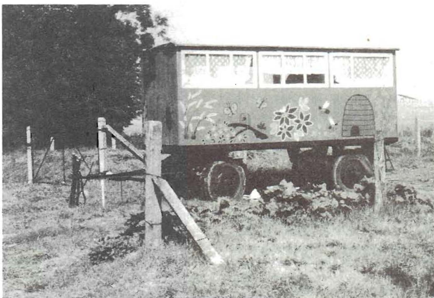
De schaftwagen bij de bijentuin in Gustävel

De uitwisseling van ervaringen verliep zo prettig, dat de tuinmedewerkers volgend jaar met een groep naar Nederland willen komen om ook hier nieuwe, stimulerende ideeën op te doen. We zullen ons best doen, hen hierbij behulpzaam te zijn. □