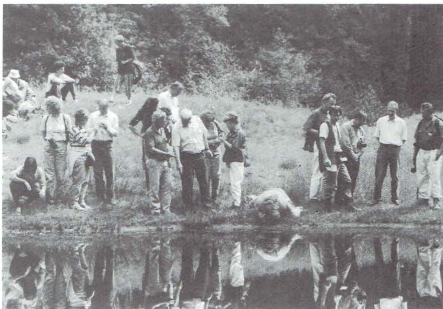
Veel interesse voor de spontane ontwikkeling in de natuurtuin in Hasselt.

Tenslotte willen we graag al die enthousiaste mensen (bijna allemaal vrijwilligers!), die ons rondleidden door hun paradijsjes en verweenden met allerlei lekkers voor lichaam en geest nog eens heel, heel hartelijk bedanken!! □