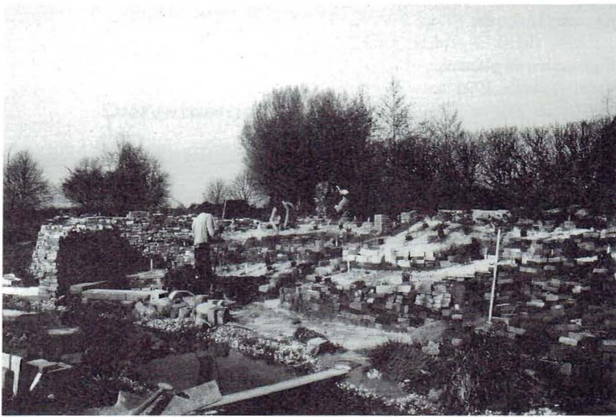
Het torentje is bijna klaar, de eerste planten zitten in de grond

der in het voormalige gymzaaltje van ons klooster gesloopt. Een container vol mooie oude stenen stond voor onze deur, en we konden voorkomen, dat deze zijn normale bestemming bereikte: een puinverwerkingsfabriek in Nijmegen. En bij Loes van der Meij in Malden mochten we een vrachtje dakpannen e.d. komen halen.