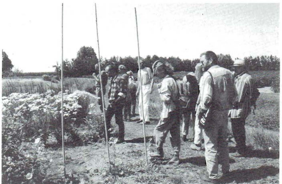
Wilde Weelde - excursie bij "De Bolderik", Wervershoof

Bloeiend en boeiend zijn niet alleen de openbare heemtuinen, maar zeker ook de natuurrijke tuinen rondom scholen.