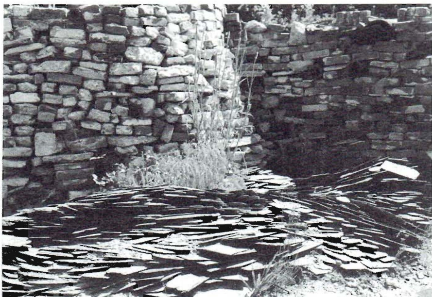
Hergebruik van kloosterstenen en kerkdakleien in de Oase-tuin

Heemtuin Malden om de vijfhonderd inbeemse boompjes en struiken te planten, volgens een plan van Paul van Eerd. In de vijver stond inmiddels water, maar het was duidelijk dat we er niet onderuit zouden komen er een ondoordringbare laag in aan te brengen. Eén ding stond vast: het mocht geen vijverplastic worden. We zochten dus naar een milieuvriendelijker alternatief. We realiseerden ons dat wij niet de enigen zouden zijn die voor dit probleem een oplossing zochten en organiseerden daarom een studiedag met als thema: "Natuur- en milieuvriendelijke vijverafdichting." Aan de kwaliteit van de voordrachten lag het beslist niet, maar aan het eind van de studiedag waren we, wat een beslissing betreft, net zo ver als er voor. We hakten de knoop door na een telefoontje van Leo Steenberg van De Keltenhof, die de vijvers in zijn voorbeeldtuinen met EPDM had afdicht en daar positieve verhalen over vertelde.