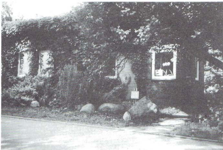
Het vakantiehuisje in Ruhwinkel

In het lentenummer van het jaar 2000 kunt u lezen hoe u het gidsje kunt bestellen.