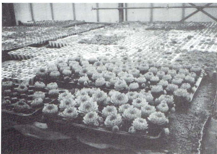
Succulentenkwekerij van het bedrijf re-natur in Stolpe, waar zich o.a. ook het IJstijdmuseum bevindt.