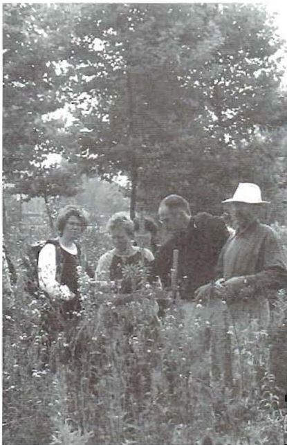
Springzaadexcursie in Maastricht (2002)

De leden van de Vakgroep Heemtuinbeheer zijn uitgenodigd deel te nemen aan een driedaagse excursie naar Zuid-Limburg (12-14 juni), met bezoekjes aan o.a. de orchideeëntuin in het Gerendal, Natuurtuin De Heebrig in Vijlen en de mooiste natuurlijke plekjes in Maastricht (waaronder een zeer sfeervolle schooltuin achter de eeuwenoude stadsmuur en de Hoge Fronten, met zijn muurhagedissen). Lid worden van deze vakgroep kunnen alle mensen die (mede-) verantwoordelijk zijn voor het beheer van natuurlijk groen (zowel vanuit een betaalde baan of als vrijwilligerswerk) en die behoefte hebben aan een prettig-informele uitwisseling van kennis en ervaring met collega's.