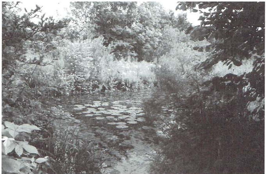
Oaseweekje: Moeras- en stinzenplantentuin van Wim en Marianne Baas in Westbroek

De Oasegids kost 14,95 per stuk (korting vanaf 5 exemplaren) plus verzendkosten (2,50) en is verkrijgbaar bij het secretariaat in Beuningen en bij een aantal bezoekerscentra en tuinen (zie voor adressen van verkooppunten: www.stichtingoase.nl ).