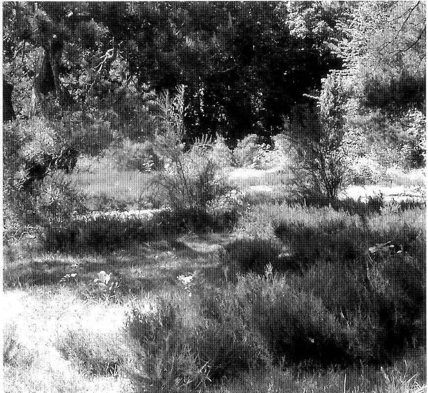
Heide op de Heimanshof