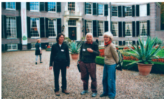
Symposium in Kasteel Groeneveld, 18 oktober 2007

Het cadeau van het ministerie van LNV ter gelegenheid van de uitreiking van de Heimans en Thijsseprijs - een dagje Kasteel Groeneveld met alles er op en er aan - pakte bijzonder goed uit. Veel belangstelling, zeer goede sfeer, levendige uitwisseling, prima verzorging door de medewerkers van het Kasteel en de catering.