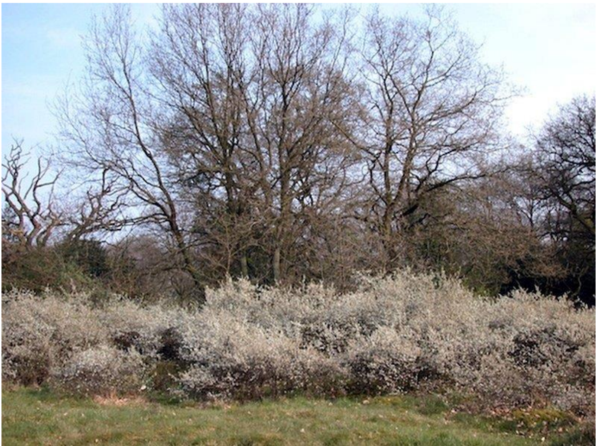
Borkener Paradies in het voorjaar met bloeiende sledoorn