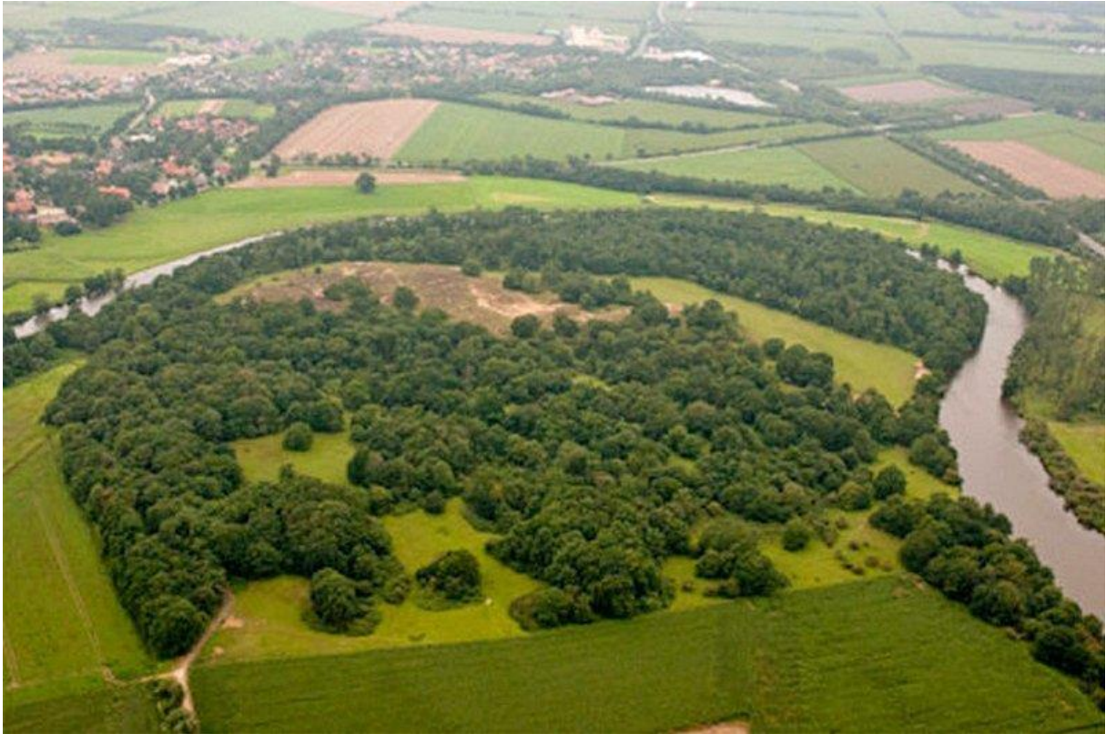
Borkener Paradies vanuit de lucht