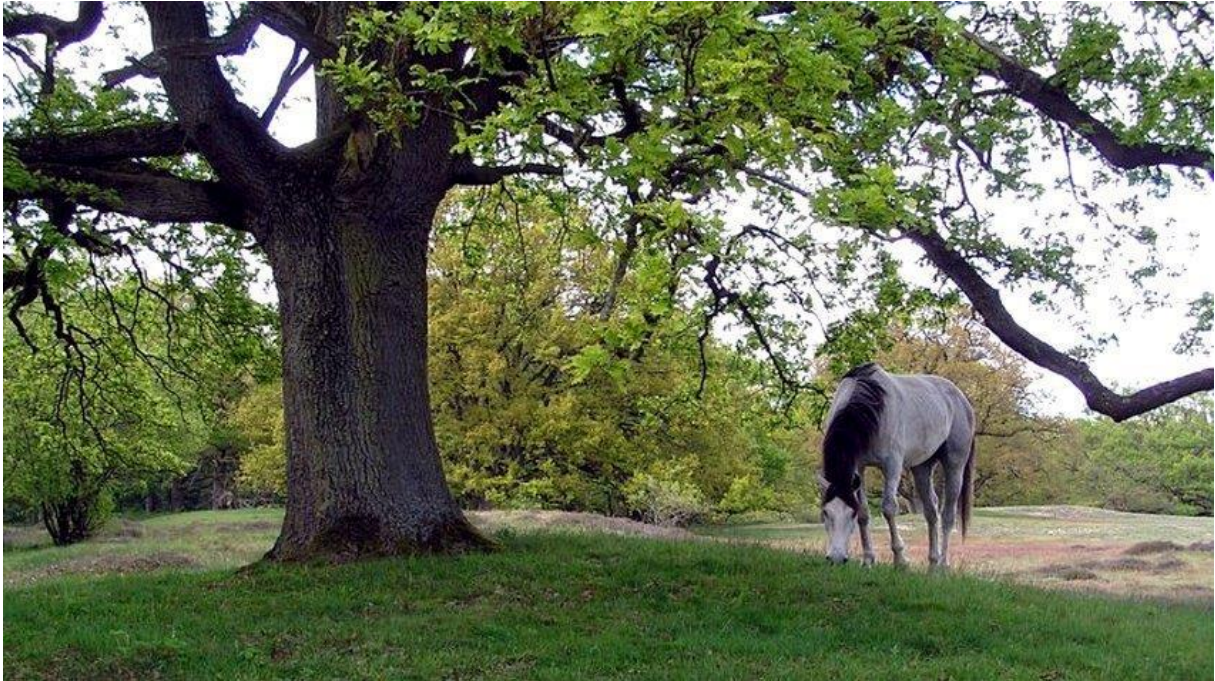
Borkener Paradies met grazend paard