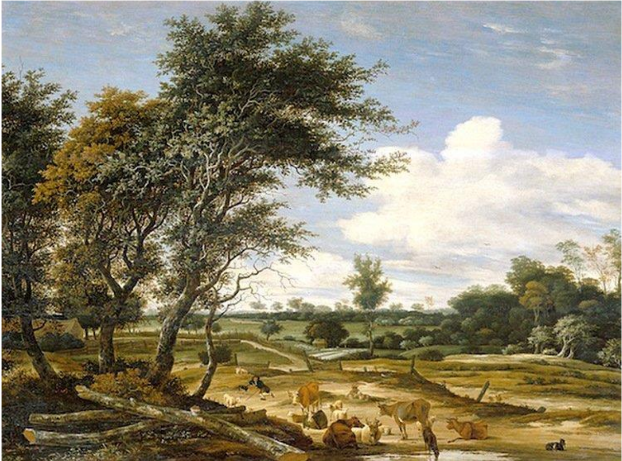
Zo liet men ook in het Borkener Paradies het vee grazen.