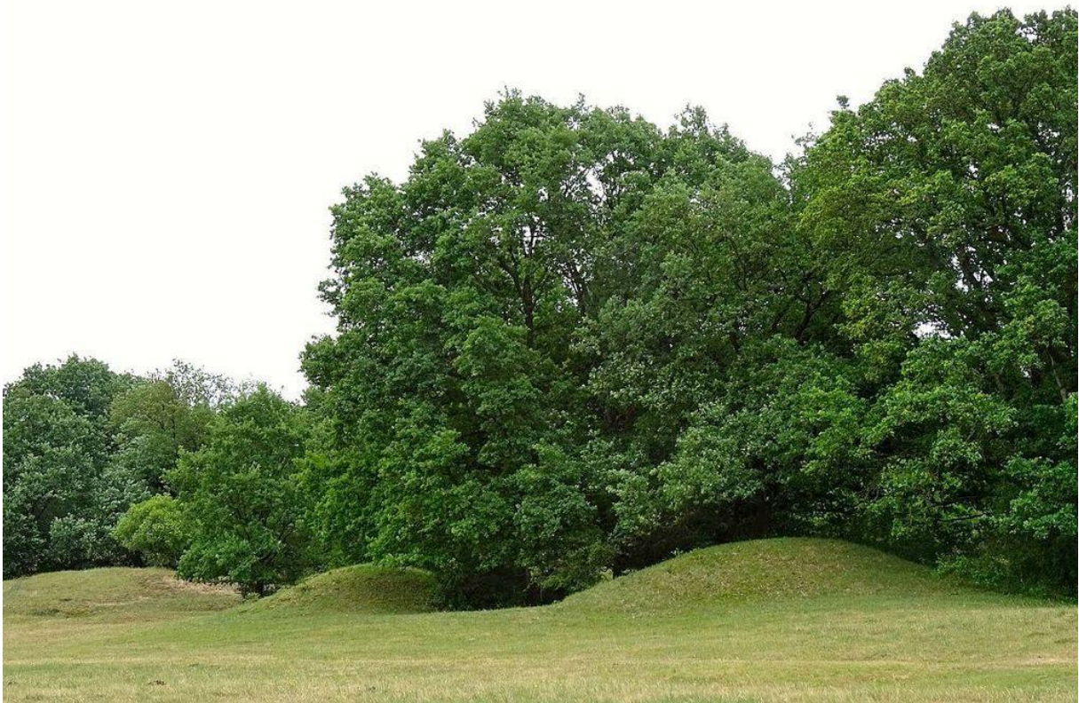
Borkener Paradies met wintereiken