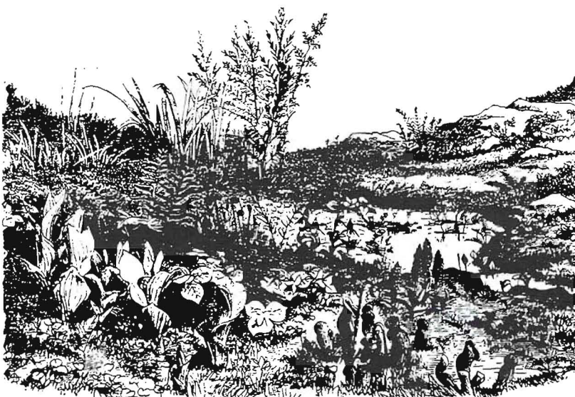
Cypripedium. Trillium. Sarracenia. Helonias. Pinguicula.

(1) "Iedereen kan een vaste plantenborder aanleggen, maar een natuurlijke tuin tot ontwikkeling laten komen is een kunst en een wetenschap."