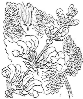
Veldsalie - Salvia pratensis