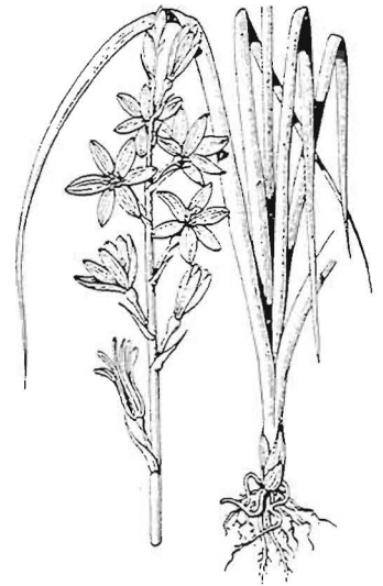
Graslelie - Anthericum liliago L.

Nu het bosje wat gewied is en bijgewerkt, is het daar heel rustig geworden. En nu blijken de vele tinten en ritmen van het blad prachtig naar voren te komen; na de bloei van de meeste voorjaarssoorten gaat dat zich voluit ontwikkelen. Groene plantenkussens ontstaan, die zich flink uitbreiden; varens zijn voldragen. In dit klimaat van kalmte en schaduw is het in de hete juli- en augustustijd heerlijk toeven. In de open zonneschijn bloeien vooral in deze tijd veel Klaprozen en Gele ganzebloemen, maar die groeien dan ineens verbluffend snel! Gele ganzebloemen zijn vaak enkele dagen na het kiemen al vrij stevige plantjes, waarin de eerste knoppen al zichtbaar zijn. Eerder gekiemde exemplaren groeiden veel langzamer. Die akkeronkruiden, dat belooft nog wat!