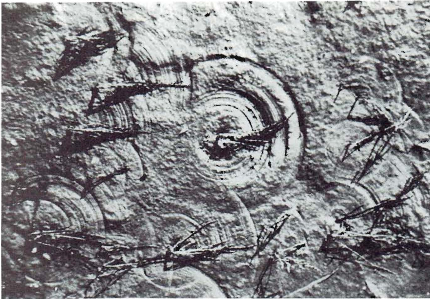
Zonlicht, wind, regen, erosie, rondvlinderende insecten, alles werkt...

tussen binnen en buiten. Het levende leven werkt spontaan, als adembaling niet in verstarde tegenstelling, maar als vrij lemniscaat. "Individu" en "omgeving" beïnvloeden elkaar wederzijds. De traditionele chinese natuurfilosofie gaat er zelfs van uit dat de gesteldheid, ja de gestemdheid van de mens rechtstreeks van invloed is op het geheimzinnig lot. Zonlicht, wind, regen, erosie, rondvlinderende insecten, alles werkt fluctuerend in op wat zich, levend of anorganisch, ontwikkelt in steeds nieuwe en verrassende patronen.