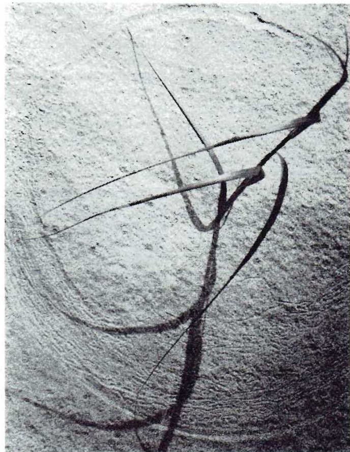
....fluctuerend in op wat zich, levend of anorganisch, ontwikkelt in steeds nieuwe en verrassende patronen.

structurele overmaat bestaat - doet echter die spontaneiteit voortdurend wezenlijk geweld aan. Onze halve planeet is uitgerooid, de rest zal