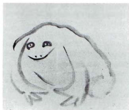
Kikvors in meditatie: "Ik mag een kikker zijn, allang had ik een Boeddha kunnen wezen." (18e eeuw)