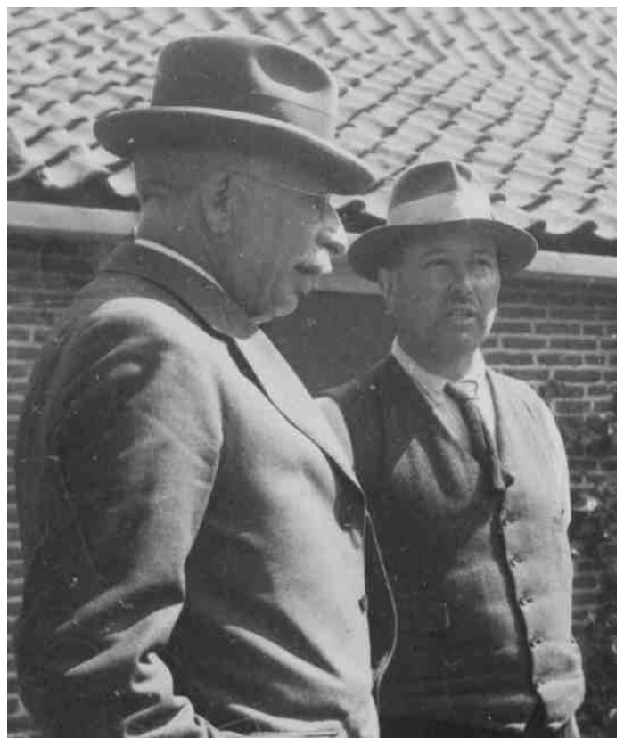
Thijssse met tuinbaas Janssen.