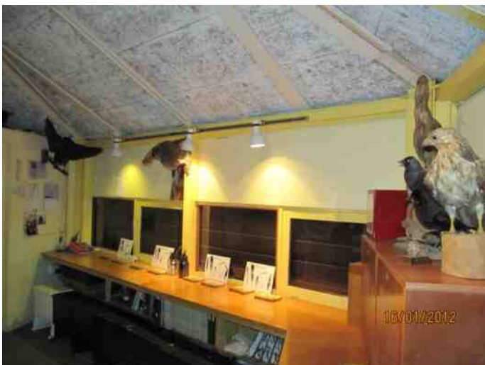
Opdracht over veren tijdens het Winterpad. Oude lokaal. De luiken zijn voor de ramen neergelaten.