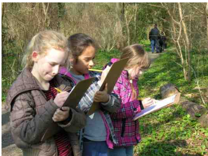
De opdrachten worden meestal met uiterste concentratie uitgevoerd.

Omdat de vijver was dichtgevroren, stond er een aquarium ter demonstratie van het waterleven. Een paar stekelbaarsjes, een poel- en hoornslak, een paardenbloedzuiger, een aantal ruggezwemmers (bootsmannetjes) en nog wat ander grut. De 6de groepers waren er niet bij weg te slaan. Zeker niet toen het stekelbaarsje het leven liet bij een aanval van een bootsmannetje. De eekhoorn buiten bij zijn voederbak stal natuurlijk de show. De opdrachten over kieming, jaarringen en vogel-, muizen- en insectennesten kwamen er maar bekaaid vanaf!