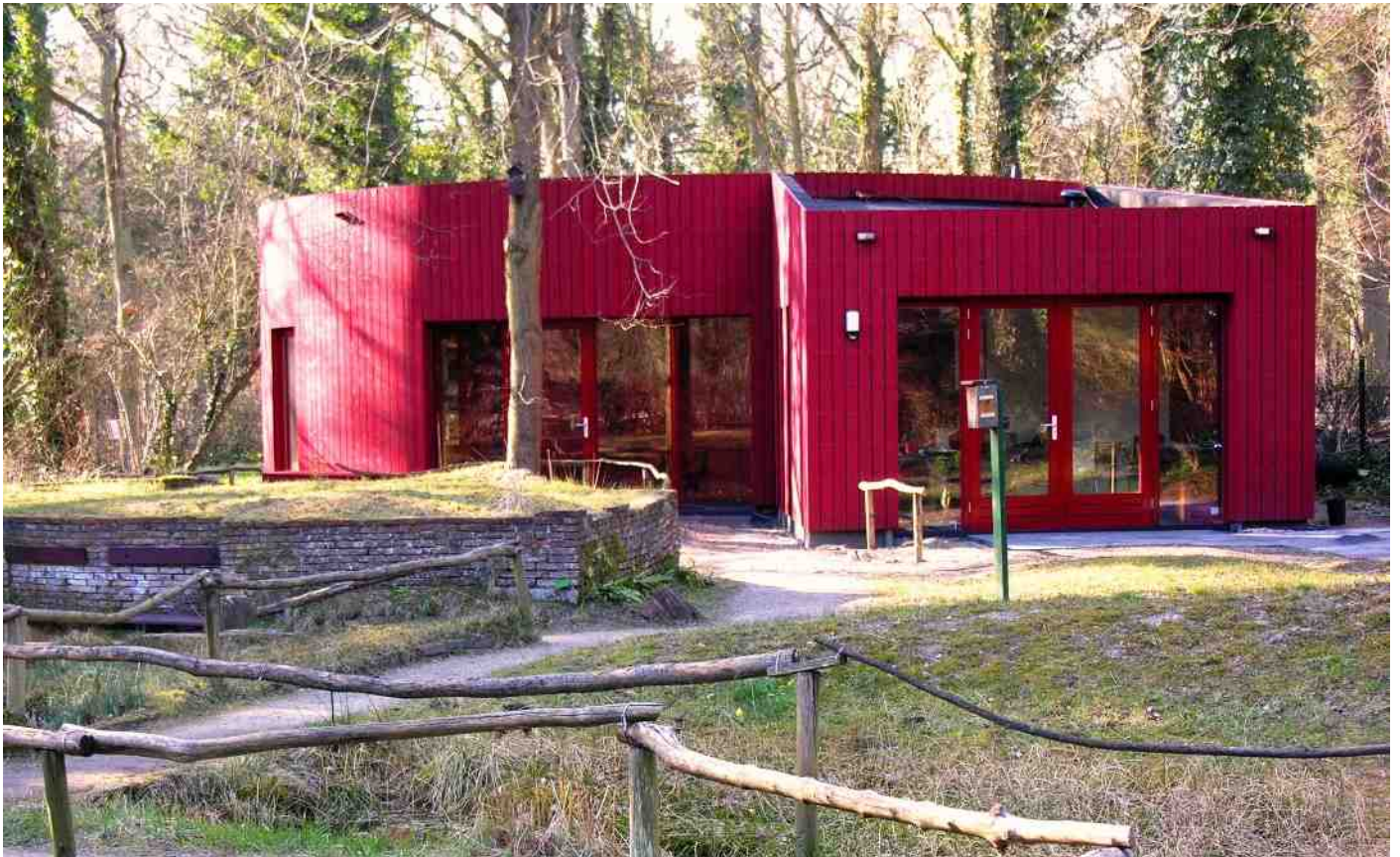
Het instructielokaal. Rechts de tuindeuren van het administratieve gedeelte, links daarvan de hoofdingang.