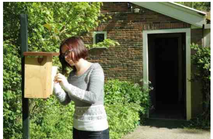
Even kijken in het insectenhotel.