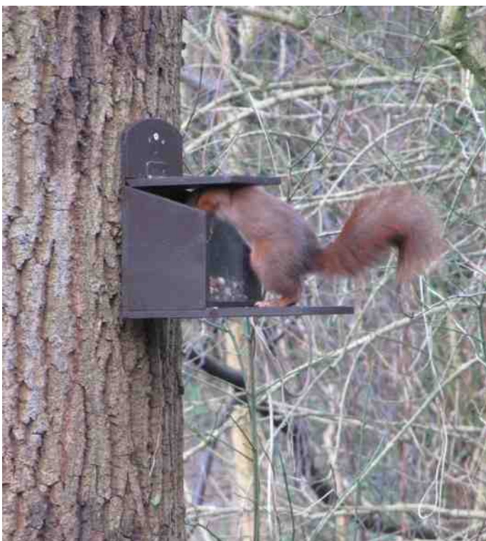
De eekhoorn verdwijnt soms met staart en al in de voederbak bij het instructielokaal.