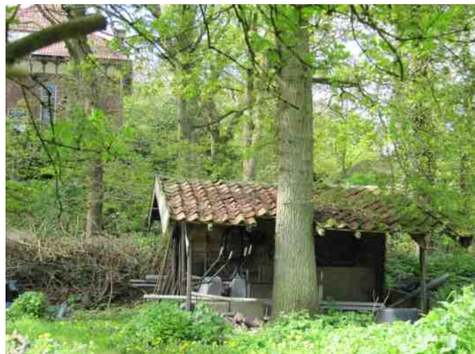
Het oude schuurtje achter in de Hof

De redactie en het bestuur van Thijsses's Hof zijn niet verantwoordelijk en/of aansprakelijk voor de inhoud van de artikelen, noch voor de gevolgen van toepassing van informatie daaruit.