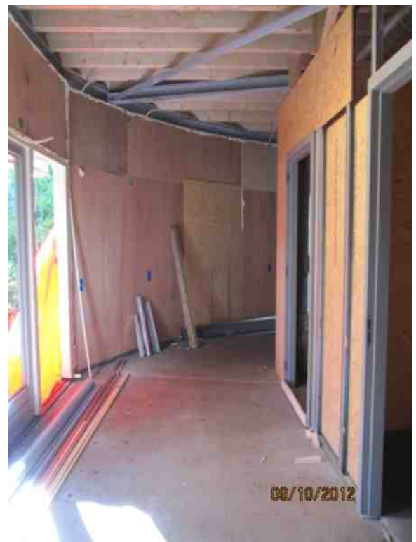
Gezicht op de entree van het nieuwe instructielokaal. Links de hoofdingang, rechts de deuren van het toilet en het invalidentoilet.