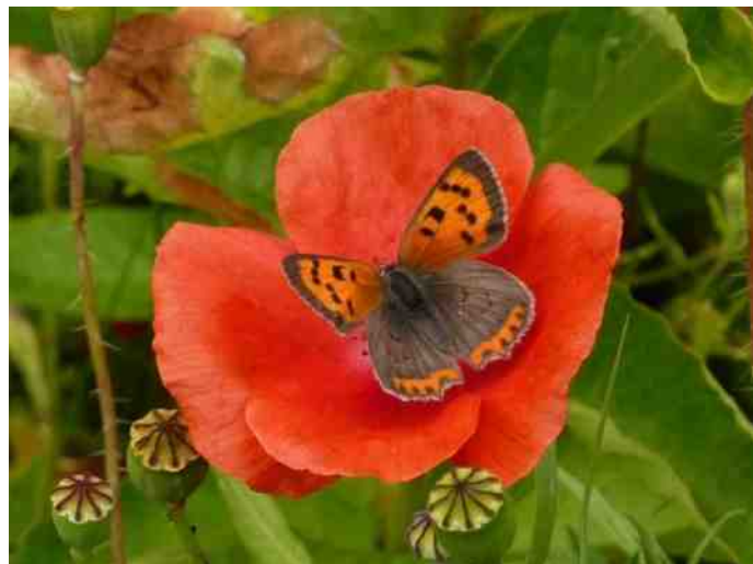
Kleine vuurvlinder.