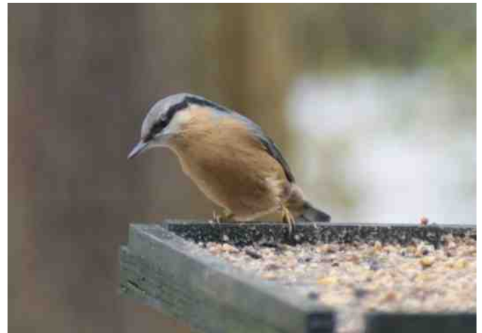
Boomklever op de voerderplank voor het Instructielokaal.