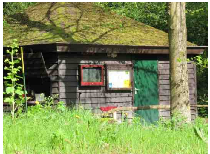
Het oude Instructielokaal, waar meer dan 25 jaar natuuronderwijs werd gegeven. Schoolklassen van meer dan 30 leerlingen kon je er met goed fatsoen niet meer ontvangen. Het aparte, knusse Hof-sfeertje zullen we wel missen.