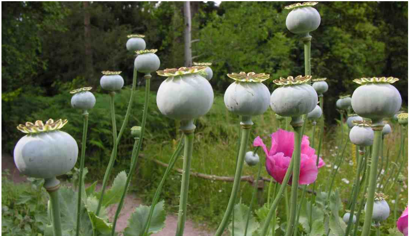
Papavers in de demonstratiestrook.