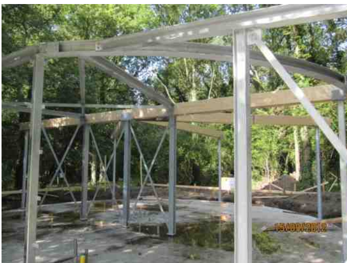
Het stalen frame is gereed, de prefab wanden kunnen gemonteerd worden. Ook de houten draagbalken voor het dak zijn ingepast.