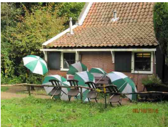
Tijdens het Herfstpad regent het. Paraplu's voor de schoolkinderen liggen te drogen voor de beheerderswerkplaats, die nu voor het achterliggende Pannenkoekenhuisje is bestemd.