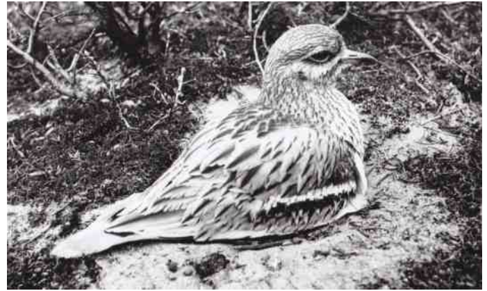
Foto van een Griel, gemaakt door Burdet. Foto Collectie Thijsse's Hof

Indien onbestelbaar: Mollaan 4, 2061 BD Bloemendaal