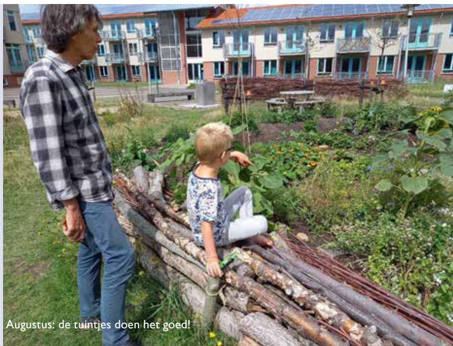
Augustus: de tuintjes doen het goed!

Vanaf die avond ging het helemaal mis. Een voor die tijd van het jaar ongebruikelijke, bijna 48 uur durende storm bracht het zout van de omliggende zee naar de Potvis. De