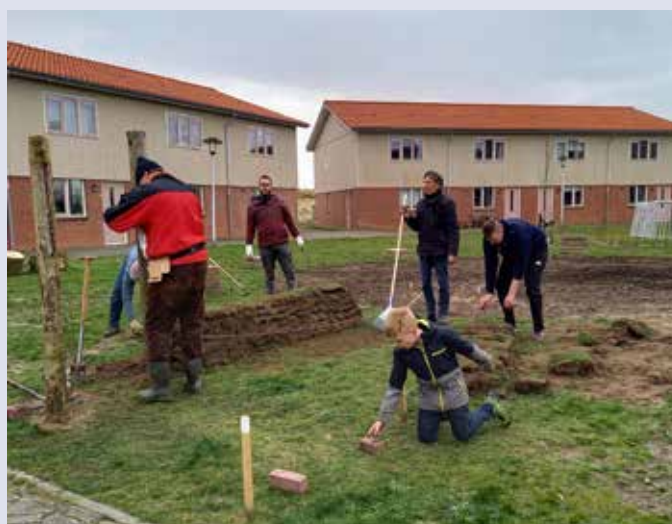
Maart: aanleg van een Texels 'tuunwalletje'

In het voorjaar werd het tijd voor de aanleg van het moestuinovaal en de kinderspeelplek, compleet met wilgenhutjes en -tunnel, en een kleine zandspeelplek, bedoeld voor de jongste Potvisbewoners. Eerst gingen we met een aantal Potvisbewoners op excursie bij andere buurttuinen, in Culemborg en Utrecht. Daarna gingen we aan de slag. Het lukte ons binnen een paar weken genoeg materiaal te