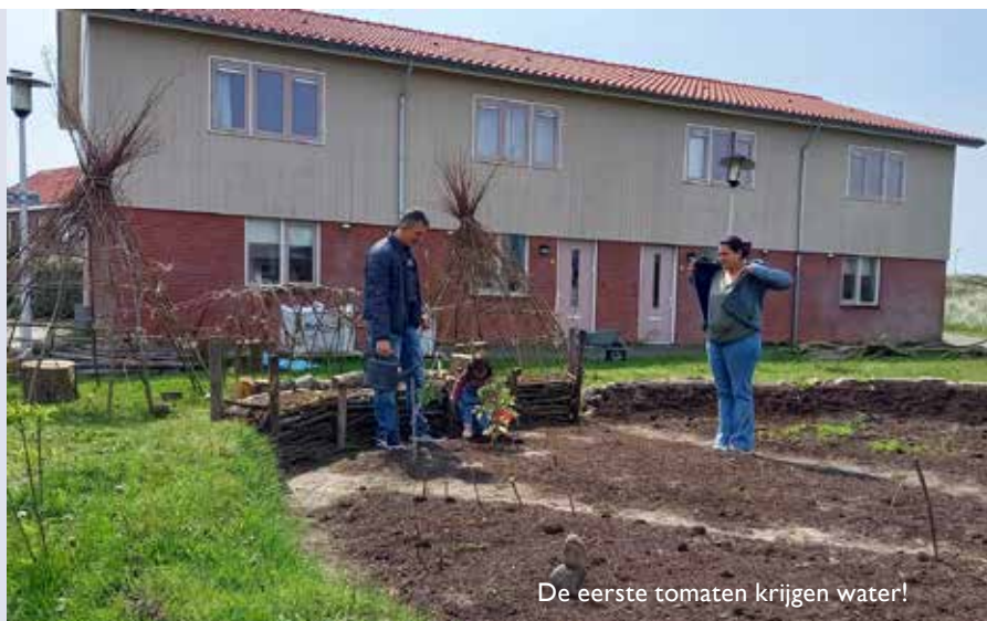
De eerste tomaten krijgen water!

verzamenen om een omwalling te maken voor het moestuinovaal. Die is onmisbaar om de zeewind te breken. We bouwden stenen muurtjes, graszodenbanken, een takkenbankje en een stammenbak. Aan de bovenkant van de walletjes werd op veel plekken Bio-Kultura grond aangebracht, die we met eetbare kruiden beplantten. Die deden het fantastisch goed, iedereen kon er naar behoefte van oogsten. Ook de varentjes en andere muurplanten groeiden als kool!