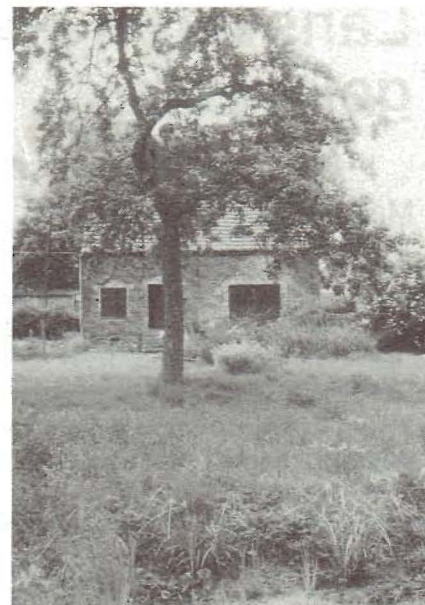
Het 'schoon parkske' in Lierde, 1989. Het hoevetje, een appelboom en op de voorgrond de vijver.

verzekeren van een uitwijkmogelijkheid in de vorm van een vervallen hoevetje met 15 are boomgaard in een gehucht aan de rand van een beekvallei in volle leemstreek. De oude boomgaard was sinds ongeveer 1975 verwaarloosd, waardoor verruiging was opgetreden; er zouden tussen 1980 en 1985 enkele behandelingen met herbiciden gebeurd zijn om Akkerdistel en Grote brandnetel te bestrijden. In elk geval was Grote brandnetel in 1985 zo goed als dominant over het hele perceel. Het terrein is geaccidenteerd door oude vergravingen en puinhopen, waaraan ik vrijwel niets veranderd heb (alleen zichtbare rommel opgeruimd). Plaatselijk heb ik het zwak naar het zuiden hellende terrein gestructureerd en in de omgeving geïntegreerd door aanplanting van houtgewas, en ben dan gewoon begonnen met de brandnetels twee maal per jaar te maaien. Alleen in de onmiddellijke omgeving van de woning heb ik plaatselijk de vegetatie verwijderd om kiemingsmogelijkheden te scheppen voor de tweejarigen die ik inmiddels in de stadstuin zo goed als kwijt was. Merkwaardig genoeg dringen die nu wel binnen in de vegetatie die zich heeft ontwikkeld tot een vrij bloemrijk ruig grasland, en lijken zich hier op de leemgrond ook langer te handhaven dan in de zandig-humeuze stadstuin. Soorten zoals Grote engelwortel, Gewoon knoopkruid, Beemdooievaarsbek en