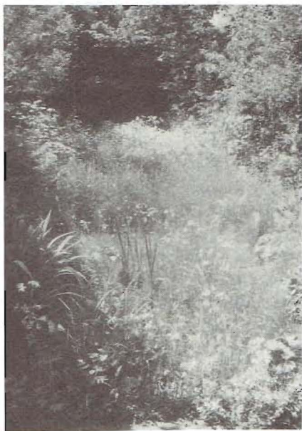
"Een paadje in de Provence"

Omdat de vorige bewoners in het tuintje kippen en aardappelen hadden gekweekt was ik wel verplicht om van nul te vertrekken. Ik bracht slechts een heel gering reliëf aan, omdat uitgesproken hoogteverschillen binnen die kleine ommuurde ruimte al te kunstmatig zouden overkomen. Zoveel mogelijk heb ik gebruik gemaakt van wat er al was: 20 cm kalkrijk en humeus zand op een midden vorige eeuw met puin en huisvuil volgegooide stadsgracht (vandaar de relatief hoge grondwaterstand: - 50 cm 's winters en - 80 's zomers); alleen plaatselijk heb