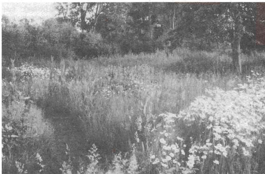
Lierde: productief grasland met veel Margriet en Kaardebol.