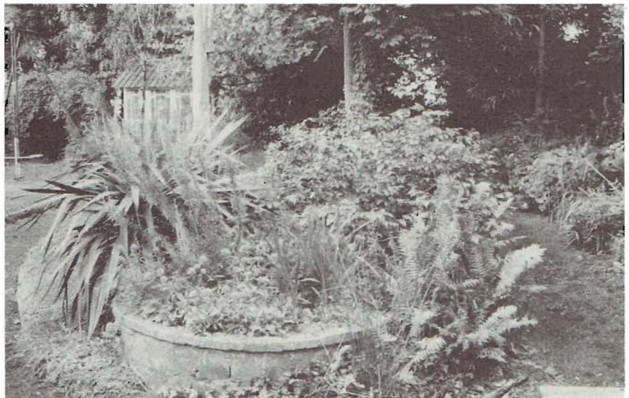
Gemetselde rotondes met laagblijvende doorlevende planten

Maar natuurlijk moest er destijds ontzettend veel in gewied en geschoffeld en gegraven worden. Er was een net van brede paden met cementstenen boorden, waartussen de grond zorgvuldig onkruidvrij gehouden werd met herbiciden. De vaste planten in de zorgvuldig op kleur en hoogte uitgekiende borders moesten om de paar jaar verplant worden, omdat ze anders in het centrum gaan verzwakken en een soort heksenkringen maken, en dan gaan ze door elkaar lopen, en dat kon niet. De struikmassieven (met Deutzia, Japanse kwee, Sierappel en groepen Rhododendron-