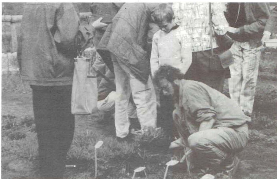
Plantenruildag in Muntendam 1987

" Open dag " op de wijknatuurtuin in Haarlem-Schalkwijk met o.a. informatiemarkt en verkoop van wilde planten en zaden. Oostenrijklaan 58, 2034 BH Haarlem, 023-363860.