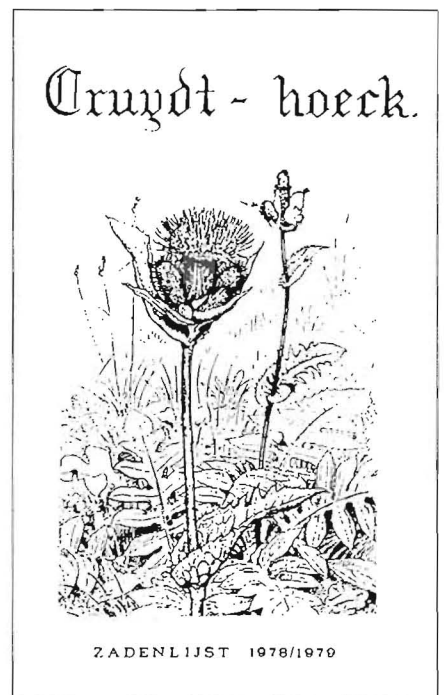
De voorkant van een van de eerste zadenlijsten van de Cruydt-hoeck

Met ingang van het seizoen 1979/1980 is de levering van zaden, die tot op dat moment door 'Amstelveen' werd verzorgd, overgenomen door kwekerij de Cruydt-hoeck. En hier begint dan de 'moderne geschiedenis' van de heemplantkwekers.