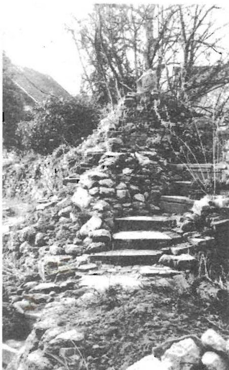
Het stapelen met puinbrokken levert tal van leefplaatsen voor planten en dieren op.

'Dat heeft die mens maar besteld! Heel aanmatigend, heel egocentrisch! Niet als liefdevolle begeleider en toeschouwer!'