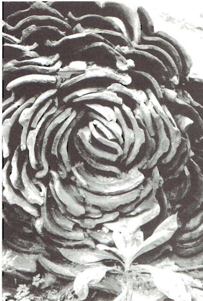
Creatief spel met dakpannen

- Kunnen er vissen in de vijvers terecht komen?