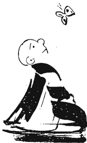
De monnik en de vlinder

'Van Schagen is een heel gevoelig mens. Die spotten met zichzelf uit zelfbescherming. Dat doe ik ook vaak. Ik heb naast serieuze ook uitermate cynische gedichten geschreven. Omdat de wereld nu eenmaal zo is. Daar word je door gekwetst, je verdedigt je door cynisme. Ik ken het van heel veel mensen. Van Schagen was niet zozeer een Boeddhist als wel een mysticus. Hij kon de manier waarop mensen met zichzelf, met andere mensen, met de