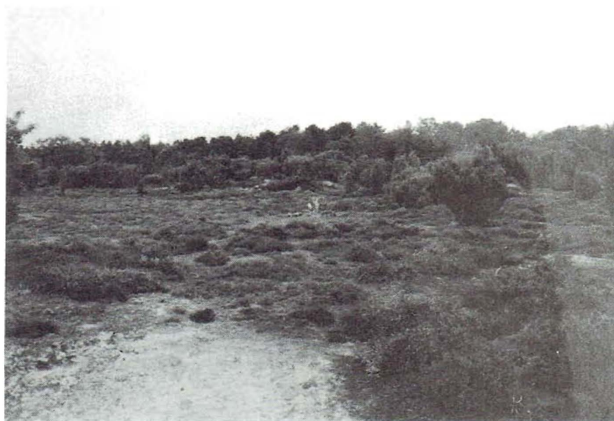
Heide: een halfnatuurlijke levensgemeenschap

Een natuurtuin is dus een tuin waar de begroeiing uit 'natuurlijke' levensgemeenschappen bestaat (zie tabel 2). In de praktijk komt dit steeds neer op halfnatuurlijke gemeenschappen daar nagenoeg natuurlijke gemeenschappen in tuinen niet haalbaar zijn. Slechts in grote natuurparken zou op den duur naturbos kunnen ontstaan wanneer er een geheel spontane ontwikkeling zou plaatsvinden waarbij de menselijke