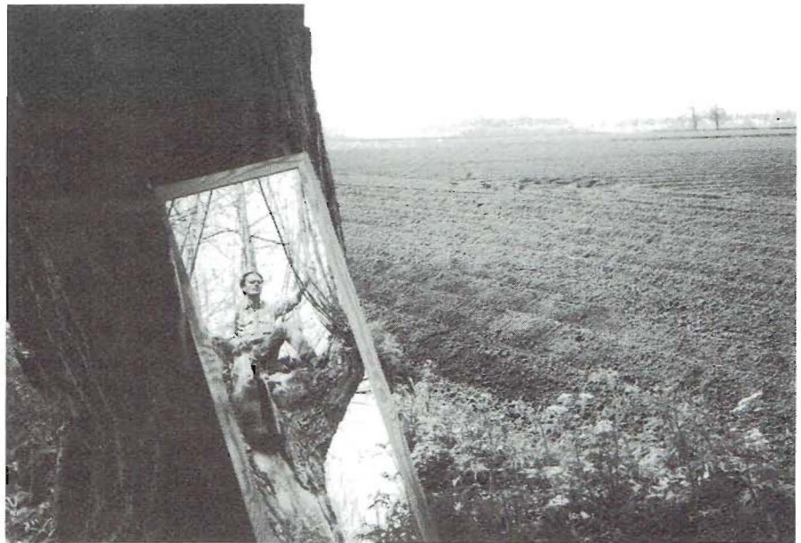
Wat is natuur?

En zo is het ook met het begrip natuur. De ruime betekenis van de natuur is bewust door de natuurbeschermers ingeperkt om duidelijk te kunnen maken wat wel en wat niet tot de te beschermen objecten behoort. En ook daarin bestonden (en bestaan er nog wel) verschillende opvattingen. Een opvatting die vooral vroeger gehuldigd werd, omschreef de natuur als de werkelijkheid om ons heen voor zover die buiten toedoen van de mens was ontstaan. De mens wordt daarbij geheel buiten de natuur geplaatst. De natuur waar het dan om gaat, betreft de zg. ongerepte