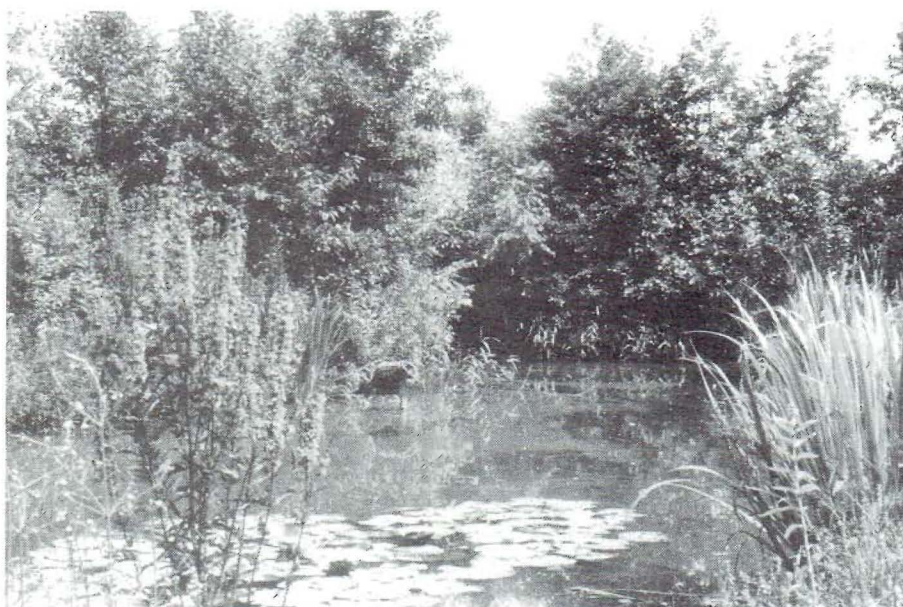
Sfeervol uitzicht over het water

Met tekstbijdragen van Ron Kroesbergen, beheerder van de Cultuurhistorische plantentuin