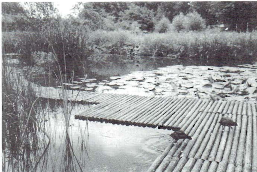
Grote vlonder in het buitendijkse griend

De tuin vindt u in de deelgemeente Charlois aan de rand van 'de groene long' in het zuidelijk deel van Rotterdam: het Zuiderpark. Tegelijk met de aanleg van de tuin zijn een grote kinderboerderij, een centrum voor natuur-