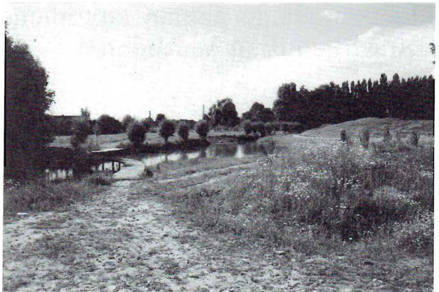
De Groene Long van Kuurne, zomer 1998

Ten zuiden van de centrale sloot, op relatief ongestoorde, weinig bemeste bodem, werd plaatselijk 15 cm afgegraven. Op de voedselrijkere percelen werd plaatselijk tot 30 cm afgegraven. Een deel van deze teelaarde werd afgevoerd, een ander deel verwerkt in ophogingen in de meest gebruikintensieve delen van het park. De voedselarme ondergrond, die vrijkwam bij het uitgraven van moeraszones en een holle weg, werd gebruikt om zachte taluds op te werpen die het park intimiteit moeten geven. Op de eerst verworven percelen had de gemeente alvast een gemengd sortiment loofbomen geplant, want het stond vast dat er een vrij groot aandeel bos moest bij zijn. Dit had het voordeel dat er bij de aanleg op die plaatsen al een enigszins gesloten bosje aanwezig was, maar legde wel een hypothek op het ontwerp, omdat uitgerekend op die plaatsen de minst gestoorde bodems zaten, die best voor natuurinrichting in aanmerking kwamen. Uiteindelijk kwam een compromis uit de bus waarbij een deel van de nog voorziene beplantingen achterwege werden gelaten, of elders in het park zouden worden uitgevoerd.