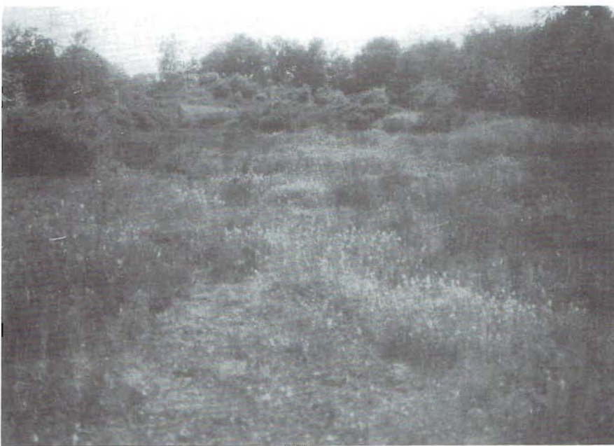
Het afgeplagde perceel in 1996

Dat niet iedereen waardering kan opbrengen voor een aantal kunstgrepen die er ook bij komen kijken (het feit dat er tuinslangen in de tuin liggen, bijvoorbeeld), of voor het toch op vrij grote schaal aanvoeren van andere grondsoorten (vooral het kalkgedeelte wijkt erg af van de omgeving), neemt Achilles er dan maar bij. Anderen zullen dan weer van floravervalsing spreken, vooral wanneer met zaden van buitenlandse herkomst (en ongetwijfeld afwijkende genetische samenstelling) wordt ingezaaid. Wanneer ik hem vertel dat ik wel wat moeite heb met