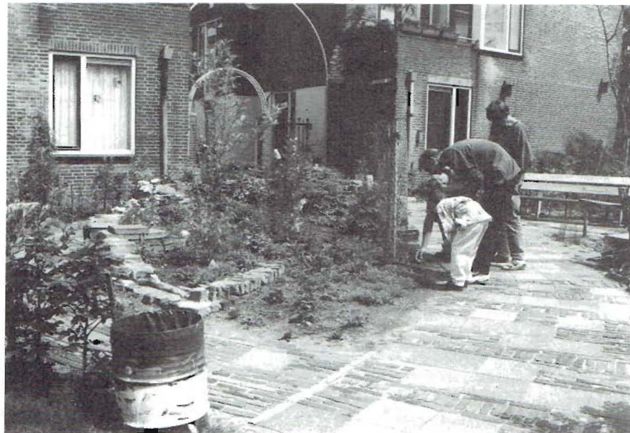
Cursus voorlichting over plantensoorten en onderhoud