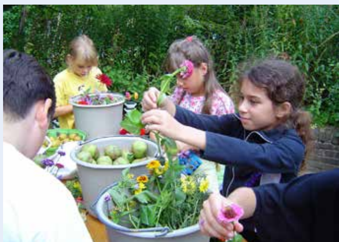
Bezig met de oogst, Educatieve Tuin de Enk

De eeuwige schooltuin, zaaien op de Zuidas, 2014. Uitgeverij Rubinstein B.V. Amsterdam.