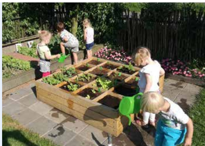
Peuters in de weer met de 'Smakelijke Moestuin'

moelijker voor de kinderwerktuinen om het hoofd boven water te houden. Subsidies werden minder of vervielen, het werd steeds moeilijker om aan zaden en meststoffen te komen. Hoe armer de bevolking, hoe meer er ook gestolen werd van de tuintjes. In de Tweede Wereldoorlog, met name in de Hongerwinter, werden ook bomen en struiken gekapt wegens brandstofgebrek.