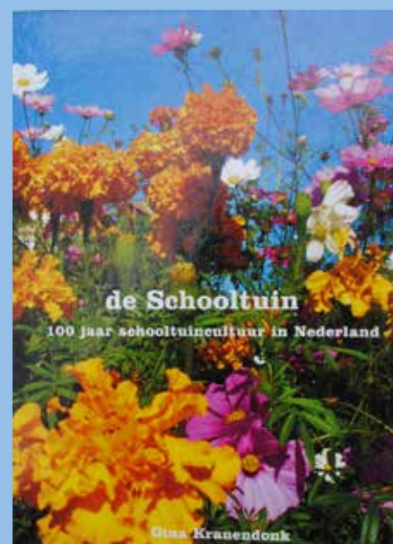
Drie toonaangevende schooltuinboeken uit 1928, 1982 en 2004