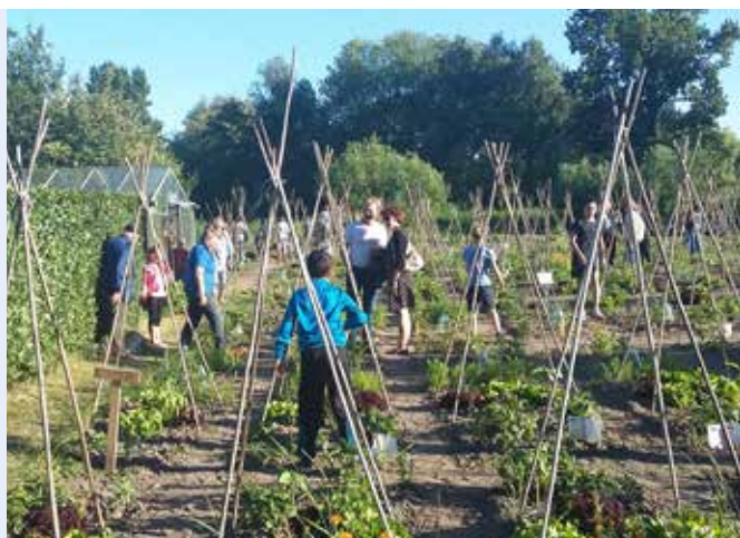
Open dag op schooltuin in Leiden