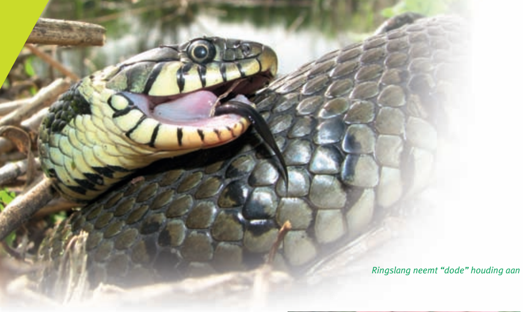
Ringslang neemt “dode” houding aan