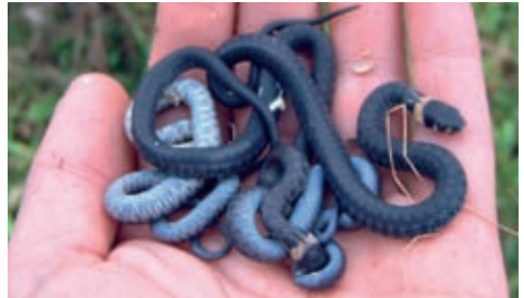
Hand jonge ringslangen

Cyclus en de gemeente Gouda doet samen met vrijwilligers van de Stichting RAVON (Reptielen, Amfibieën, Vissen, Onderzoek Nederland) onderzoek naar de Goudse ringslangen. In de